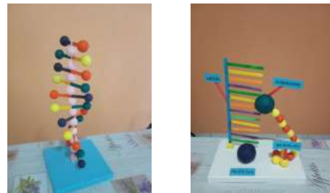
Figura 2- Modelos didáticos finalizados.

Duplicação: A duplicação do DNA ocorre dentro do núcleo da célula, este processo consiste na síntese de novas a partir de uma estrutura parental já formada, baseando-se no modelo dupla hélice de Watson e Crick, resultam a partir de um processo de emparelhamento (complementaridade de bases). Transcrição: Este é o processo da formação da fita de RNA, para formar uma nova fita é necessário uma fita molde que está presente na dupla hélice de DNA. Tradução: A tradução do DNA é o processo em que a informação genética contida no RNA mensageiro (mRNA) que foi copiada do DNA é convertida em uma sequência de aminoácidos, formando uma proteína.