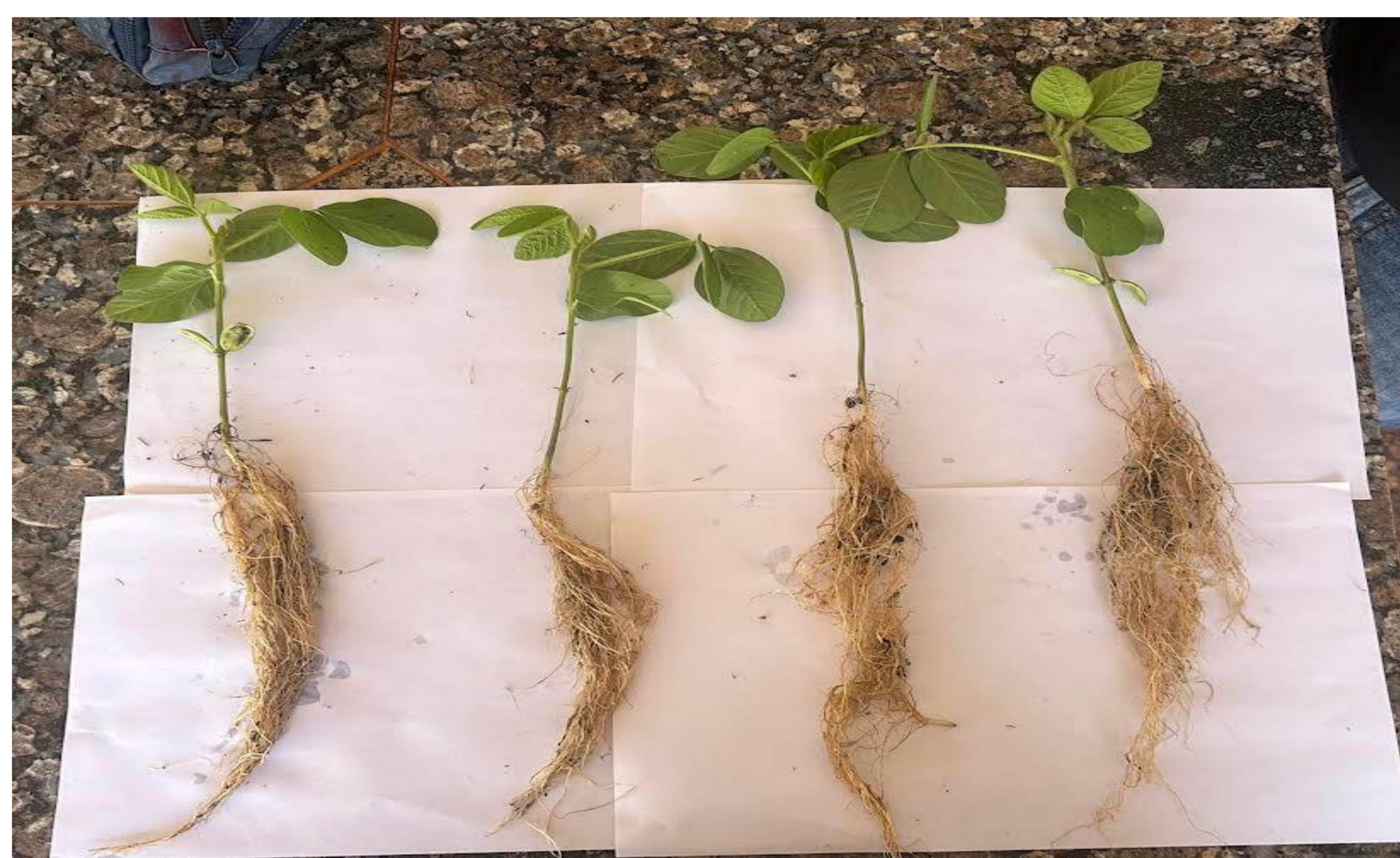
R1 - Sem inoculação; R2 - ActibioEvo53® ( Azospirillum brasilense , cepa HM053) R3 - ActibioBrady® ( Bradyrhizobium sp.); e R4 - Co-inoculação (ActibioBrady® + ActibioEvo53®).