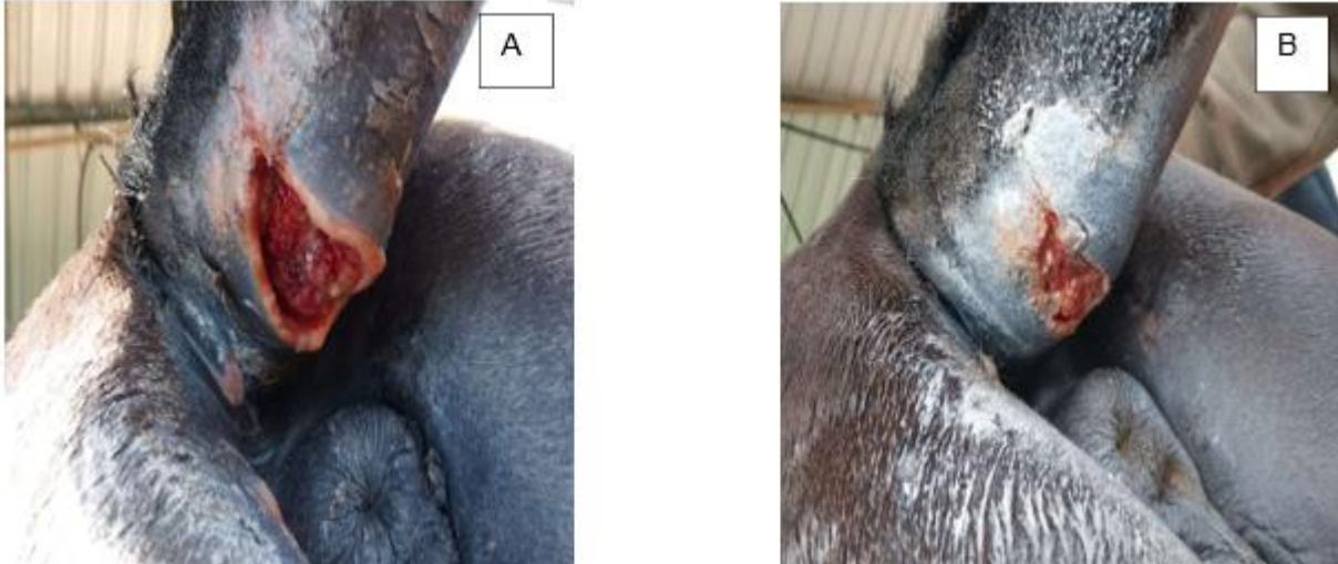
Figura 5 – Equino, fêmea, raça crioula