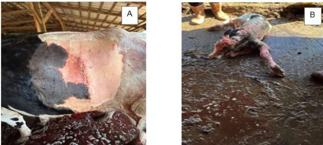
Figura 3 – Bovino fêmea de aproximadamente 4 anos