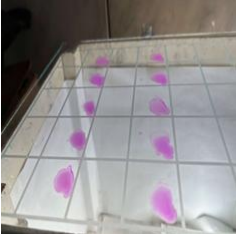
Figura 1 – Teste de reação do soro sanguíneo coletado dos animais