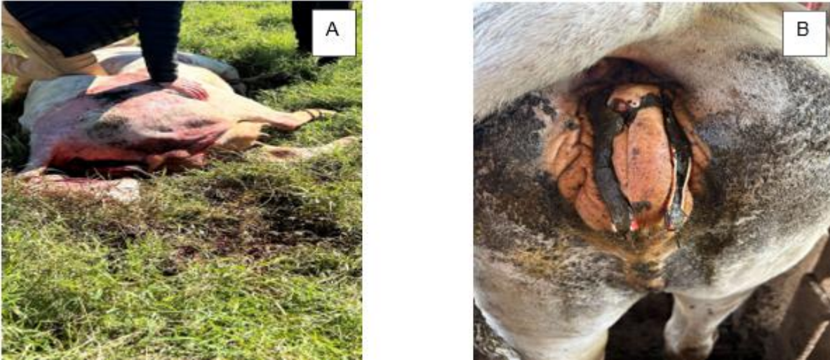
Figura 2 – Bovino fêmea de aproximadamente 3 anos, raça Nelore