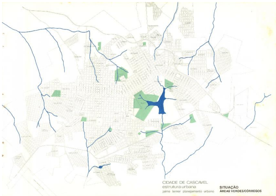
Figura 1 - Mapa das áreas verdes em Cascavel (1978).

organizações internacionais determina, pelo menos, 12m 2 /habitante (PREFEITURA MUNICIPAL DE CASCAVEL, 1978. p. 12).