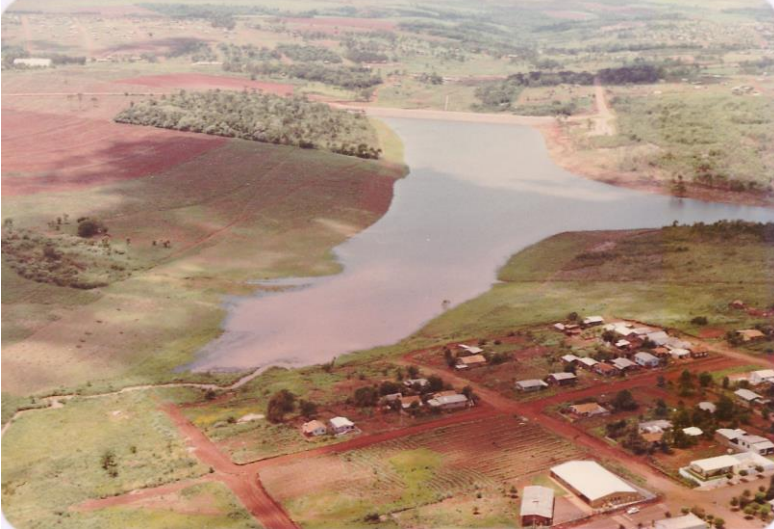
Figura 4 - Construção do Lago Municipal na década de 80 9