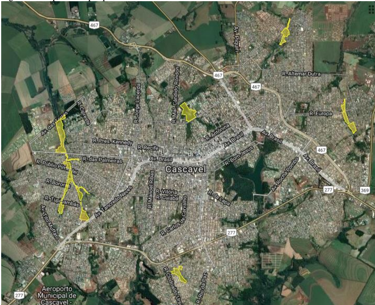
Figura 2 - Mapa novos parques lineares de Cascavel