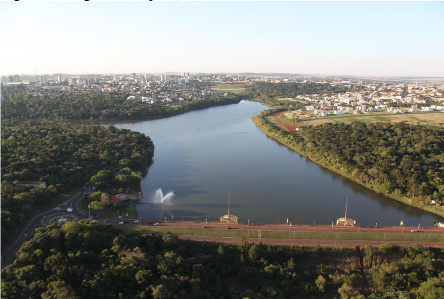
Figura 5 - Lago Municipal (2015)

Fonte: Parque Municipal Danilo Galafassi, 2016. Autor: Giovani Definski.