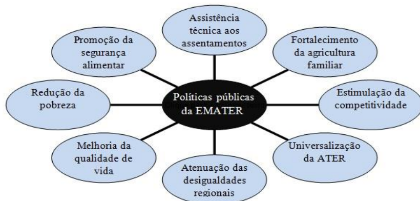
Figura 3 – Políticas públicas do Instituto EMATER para a população rural