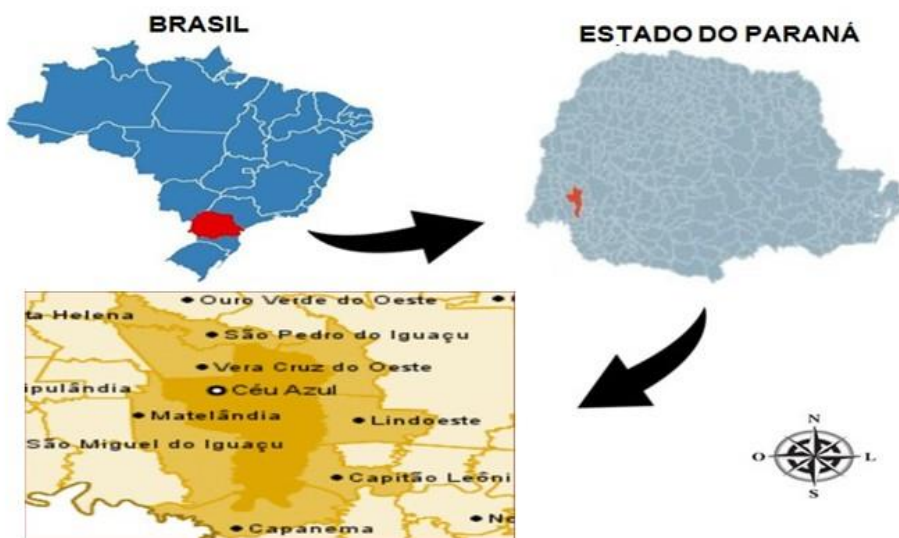
Figura 1 – Mapa de localização geográfica do município de Céu Azul/PR

Fonte: Elaborado com base em IPARDES (2012).