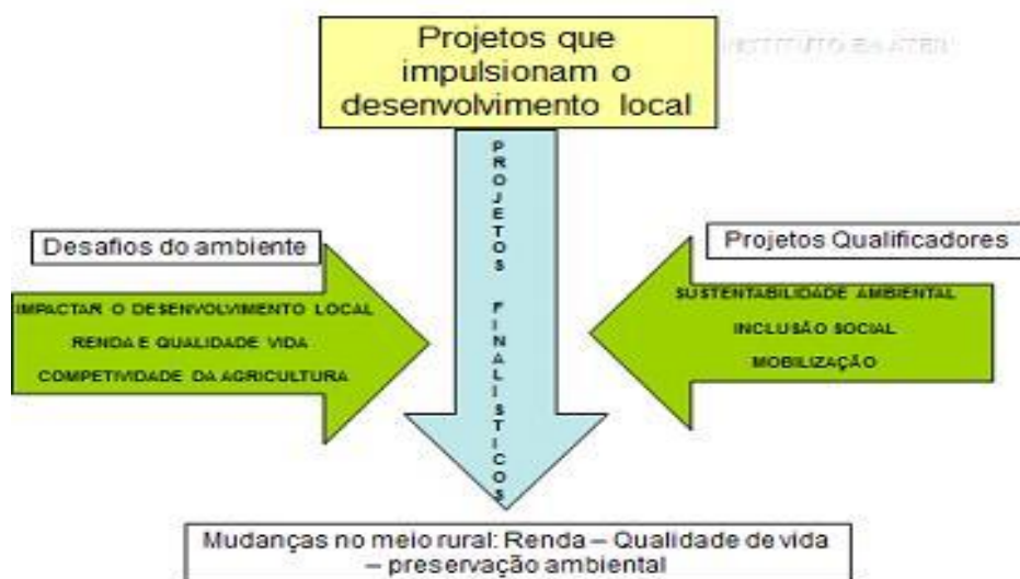
Figura 5 – Projetos que impulsionam o Desenvolvimento Local