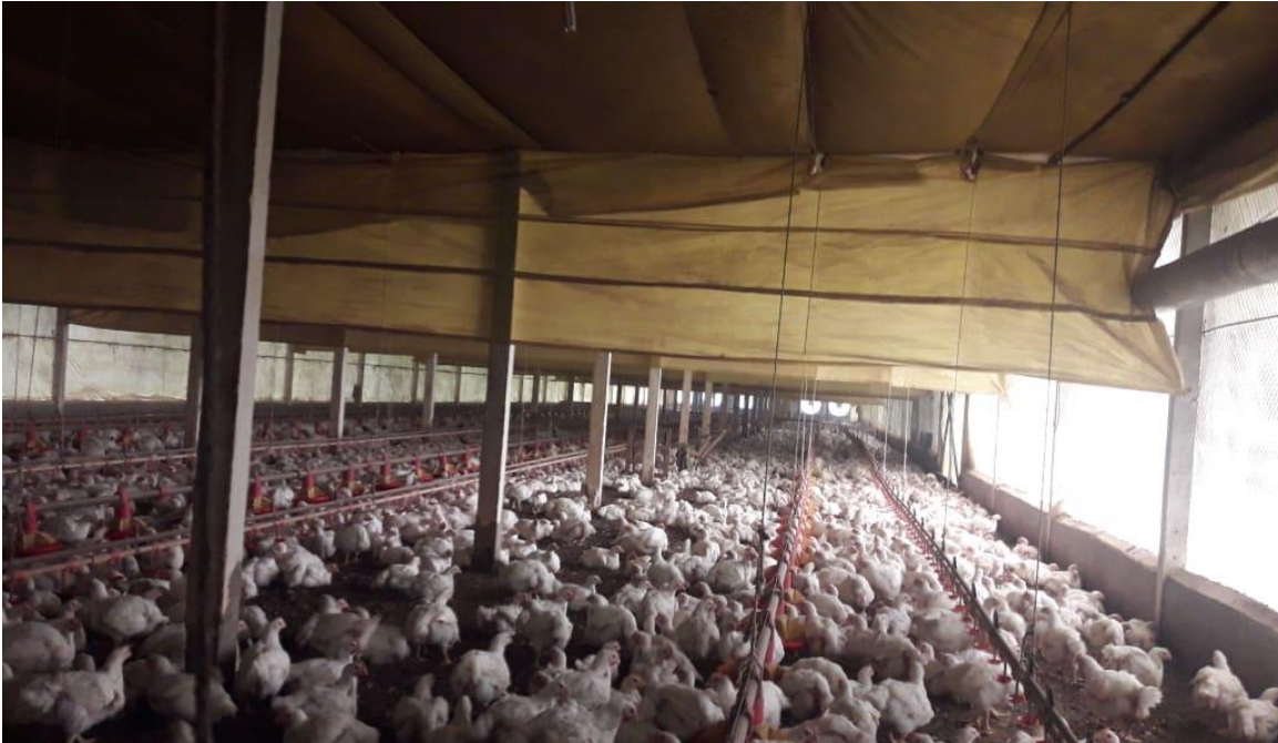
Figura 1 - Aviário com criação de frango de corte, com 30 dias